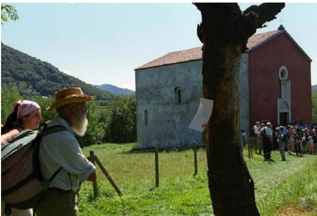
Pellegrini della prima edizione de La Via Lattea (2004)