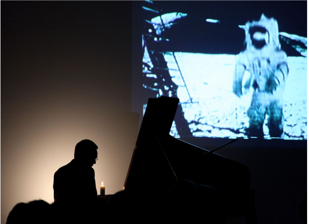
Chiaro di luna con astronauti, LaVia Lattea 6 (2009)