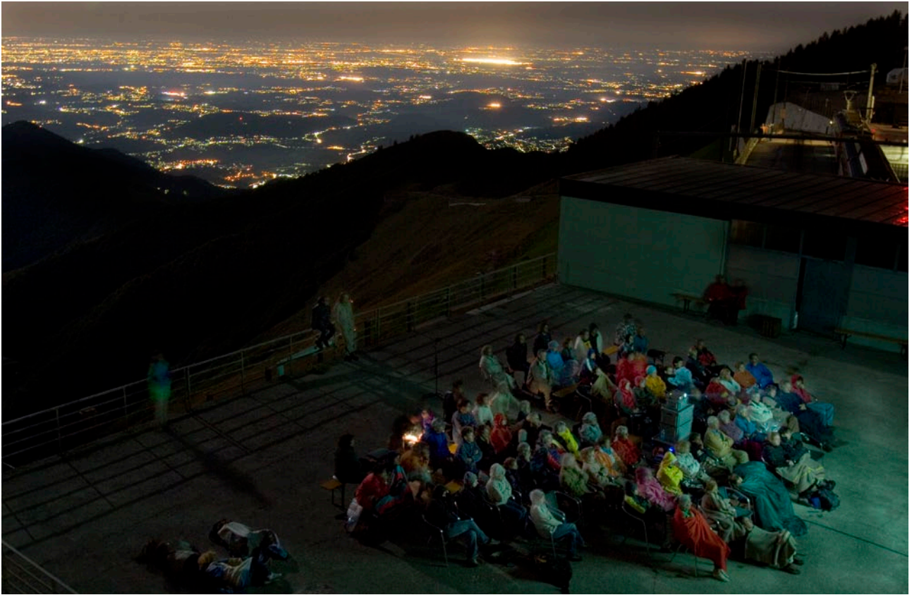
Pubblico de LaVia Lattea 4 sulla vetta del Monte Generoso (2007)