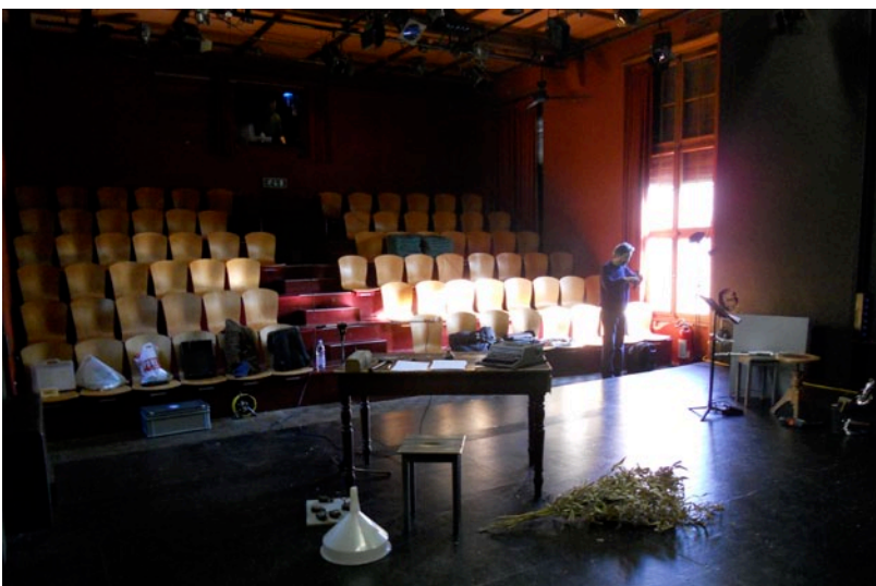
Il teatro Paravento di Locarno