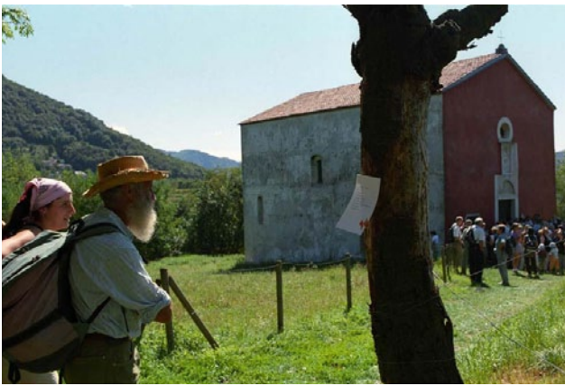
Pellegrini della prima edizione de La Via Lattea (2004)