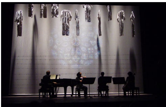
Quartetto per la fine del tempo (2003)

2010, Mendrisio, Riva San Vitale, Castel San Pietro, Carona