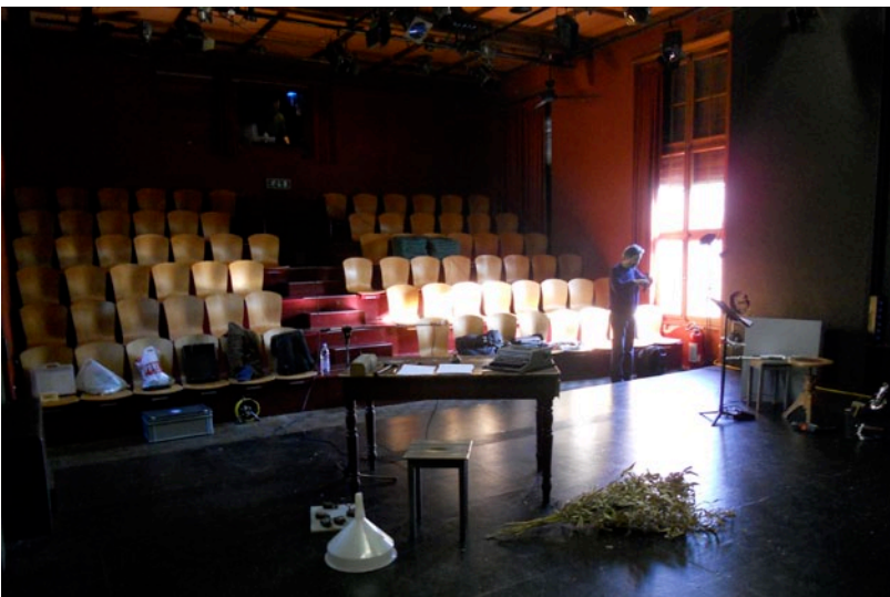
Il teatro Paravento di Locarno

e responsabile del settore musicale di Radio svizzera Rete Due